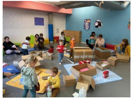
Inter-Relais Eveil Pop - Ouistreham et Colleville Montgomery