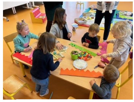
Fabrication de couronnes