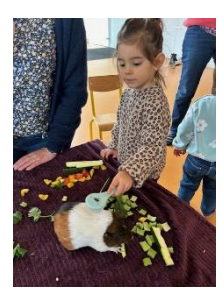
Séances de médiation animale