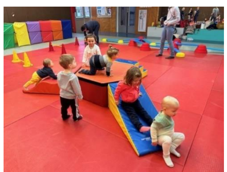
Inter-relais Baby Gym