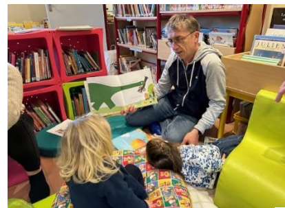
Séance de lectures partagées