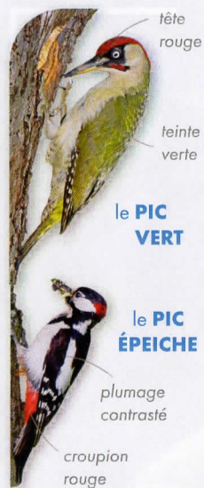
le PIC ÉPEICHE